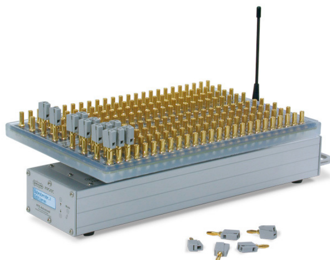
Unità ricevente con modulo matrice 100 Output