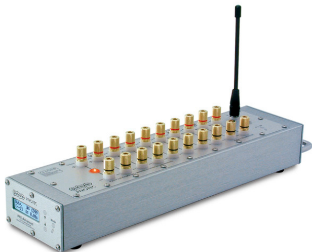
PFE Advanced 10 Output